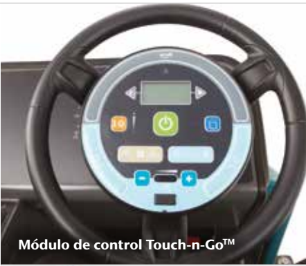
Módulo de control Touch-n-Go™

▶ El módulo de control Touch-n-Go™ con botón de inicio 1-Step™ que permite a los operarios acceder rápidamente a todos los ajustes sin retirar las manos del volante.