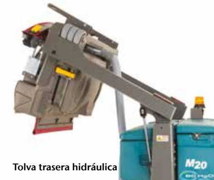
Tolva trasera hidráulica