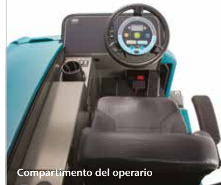
Compartimento del operario