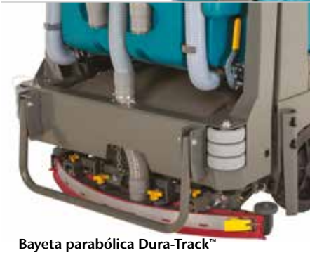
Bayeta parabólica Dura-Track™

Tejadillo de protección que previene que el operario sea golpeado por objetos que salgan despedidos.