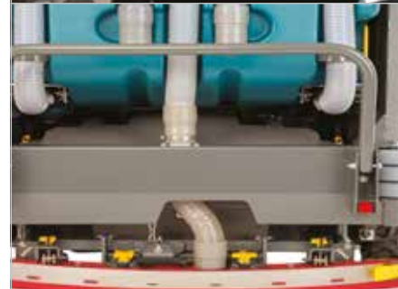
Puntos de contacto amarillos para el mantenimiento