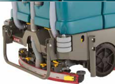
Dura-Track™ parabolisch dweilframe

▶ Eenvoudig te openen ontwerp biedt snelle toegang voor onderhoud en zichtbaarheid van ingebouwde diagnostiek, dit helpt stilstand te minimaliseren en onderhoudskosten te verlagen.