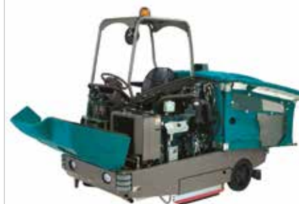
Ontwerp met gemakkelijke toegang

▶ Zwaar frame met beschermende hoekrollers beschermt zowel uw faciliteit als de machine.