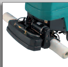
1610 - ролики для поддержания чистки