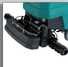
1610 - щетки для восстановительной очистки