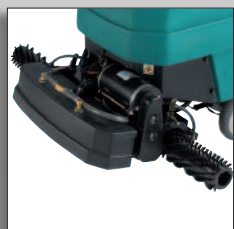
Les brosses de la 1610 pour nettoyage-rénovation